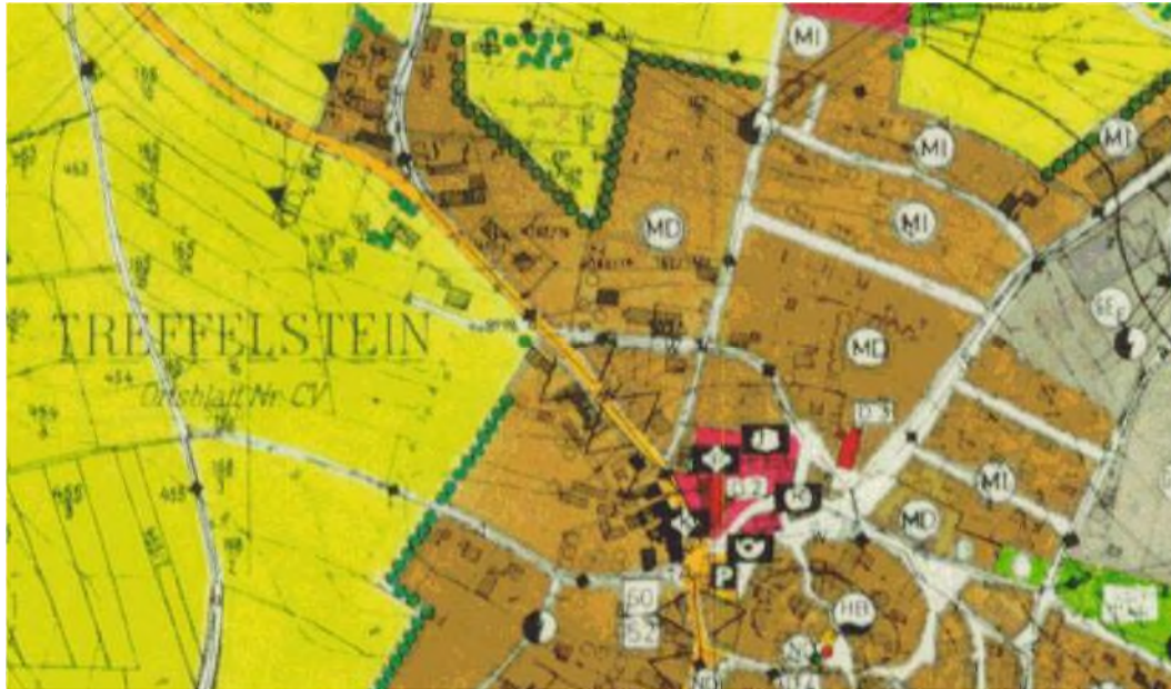
Abb.2: derzeit gültiger Flächennutzungsplan

Die Aufhebung des derzeitigen Bebauungsplanes hat keinen Einfluss auf die Umsetzung der Ziele und Grundsätze der Landes- und Regionalplanung. Die Fläche des Geltungsbereichs der Bebauungsplanaufhebung ist im rechtswirksamen Flächennutzungsplan als Dorfgebiet dargestellt.