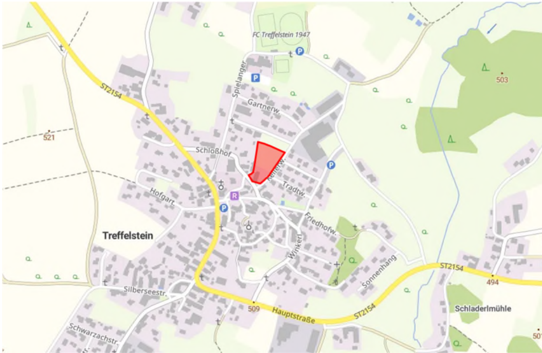
Abb. 3: Übersichtslageplan